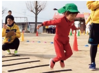
両足連続跳び越し