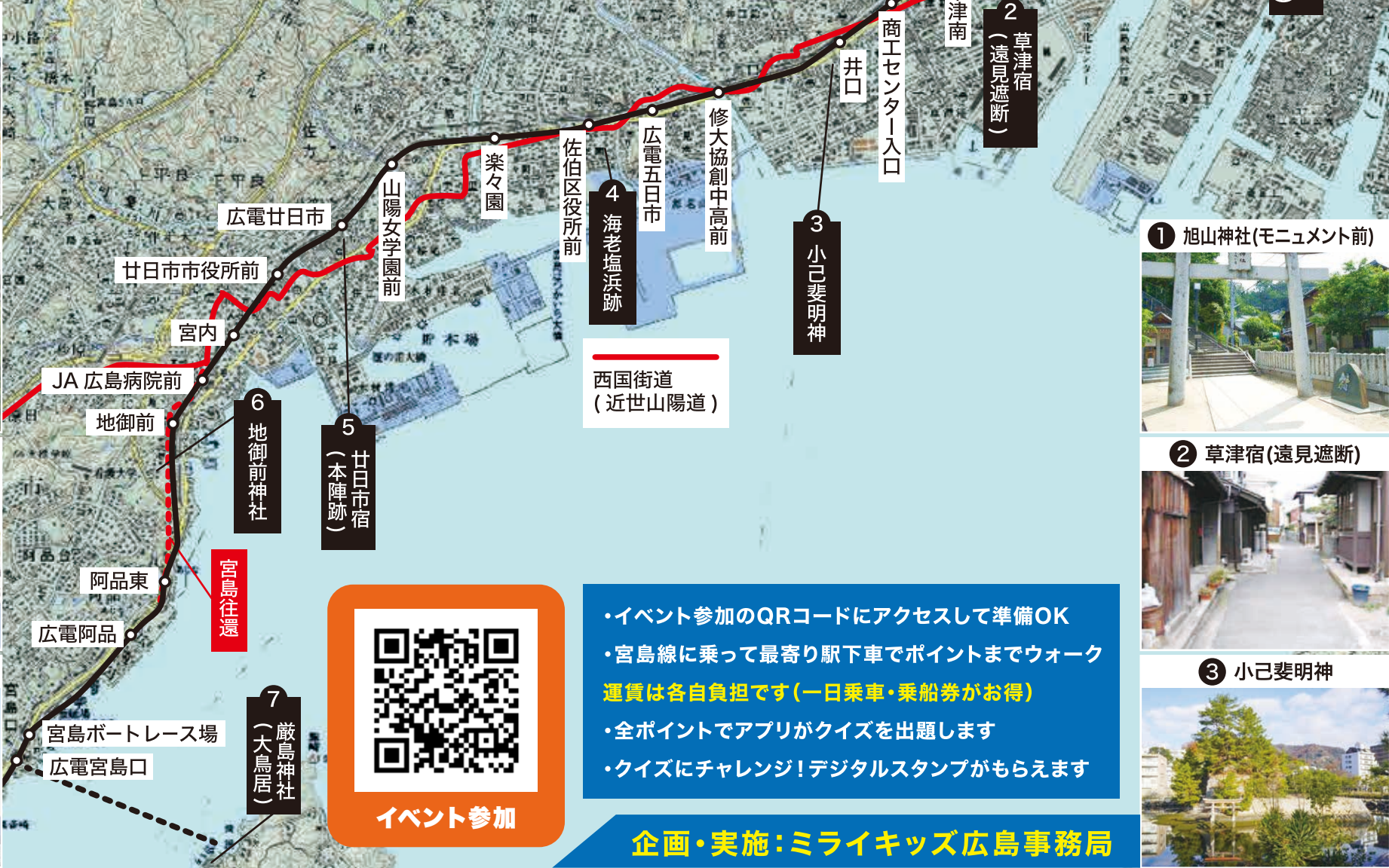
① 旭山神社(モニュメント前)